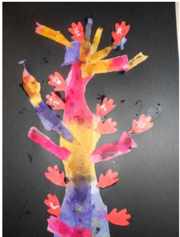
Sylvie Carsenac, conseillère pédagogique départementale en arts visuels