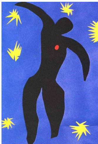
Henri Matisse « Jazz » 1947