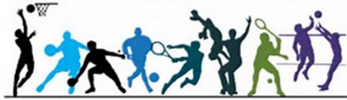
Les activités enseignées

Notre école dispose d'un terrain de handball, d'un terrain de basketball, d'une salle de motricité. Nous assurons donc des heures d'EPS toutes les semaines. Une tenue de sport est par conséquent indispensable.