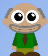
Coordonnateur du PIAL