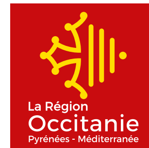
Carole DELGA Présidente de la Région Occitanie Pyrénées-Méditerranée